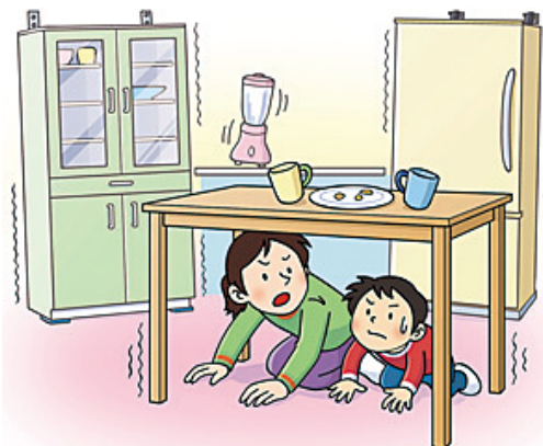
家具などの固定は必ず行いましょう。

この機会に家族で、家の中で危険なところがないかを点検して、もしものために備えましょう。 ちよつとした安全を確保することで大きな被害にならずに済むことがあるかもしれません。地震はいつ起こるかわかりません。