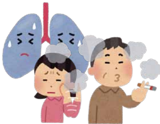
参考「カラダご医見番第238回」

受動喫煙と乳がんについては国立がん研究センターによると閉経前の女性の場合、自分自身が非喫煙者でも 「たばこを吸う人と10年以上、一緒に住んでいた」「家庭以外で、毎日1時間以上、たばこの煙を吸う機会がある」 などの女性は、乳がん発症リスクが1.5～2.6倍に 上昇する と発表しています。